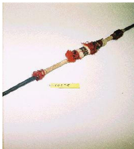
Sagaie à deux pointes, bois, bambou, poil de roussette, fil, sparterie, tapa, Nouvelle-Calédonie, musée municipal, Pithiviers

Cette Micro-folie, initiée par La Villette en lien avec le ministère de la Culture, traduit une volonté de rapprocher l'art de ceux qui en sont éloignés, ce qui les incitera ensuite à se rendre dans les musées pour admirer leurs chefs d'œuvre "en vrai". Volonté entièrement partagée par la direction de l'action culturelle. Pithiviers accueille la troisième Micro-folie de la région Centre - Val de Loire. Ce dispositif est déjà installé au Parc de La Villette (Paris), Sevran, Denain, Lille, Dreux, Courtenay et, à l'international, à Mexico et Pékin. Le ministère de la Culture et la Banque des territoires, dans le cadre de l'opération Action Coeur de Ville, accompagnent financièrement sa mise en place. Les beautés de notre patrimoine artistique et culturel se livrent à vous à L'Expo à partir du 4 octobre 2019.