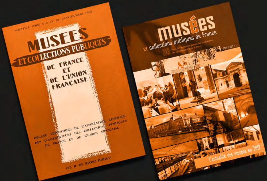
Couvertures de la revue Musées et collections publiques de 1955 et de 2012.