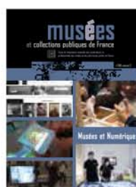
285 Musées et Numérique Vol. 2