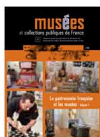
286 La gastronomie française et les musées Vol. 1