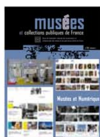
282 Musées et Numérique Vol. 1