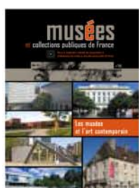
283 Les musées et l'art contemporain