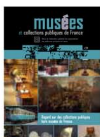
284 Regard sur des collections publiques hors musées de France