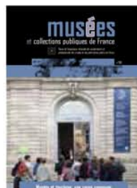
281 Musées et tourisme, une cause commune