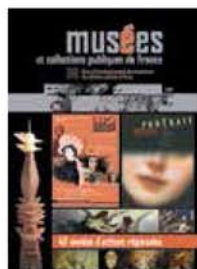
279 40 années d'actions régionales